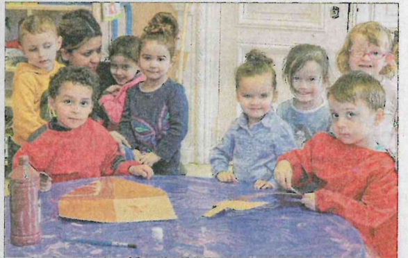
Les plus petits confectionnent des épées et des boucliers.