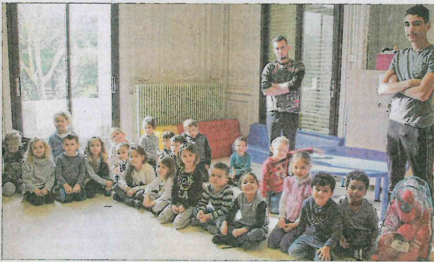
Les 4/6 ans, réunis avant d'aller s'adonner à l'extérieur à des jeux sportifs.