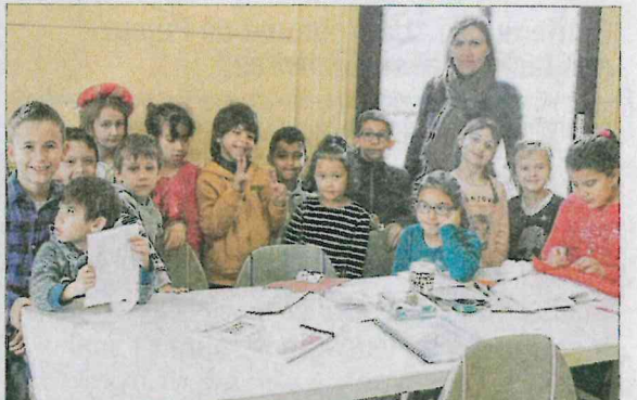
Les autres 6/8 ans s'adonnent à des activités manuelles.

Le centre d'animation socio-éducative de la ville de Sorgues (Casevs), qui a ouvert ses portes depuis le lundi 13 février, accueille les enfants âgés de 3 à 10